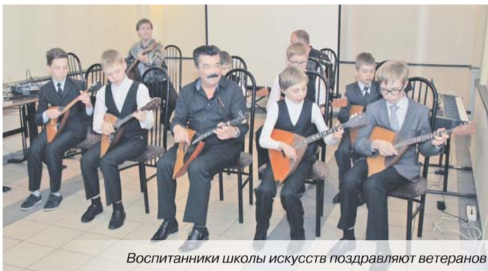
Воспитанники школы искусств поздравляют ветеранов