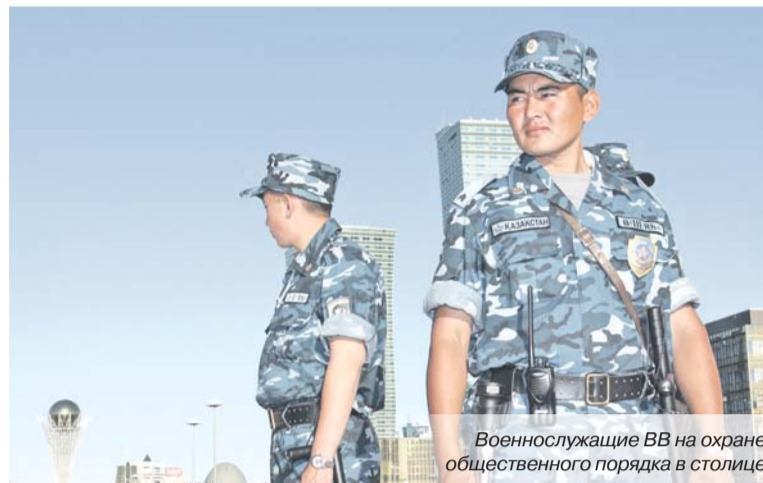
Военнослужащие ВВ на охране общественного порядка в столице

Процедура проводится в присутствии администратора, который является государственным служащим уполномоченного органа по делам государственной службы или его территориального подразделения, а также оператора тестирования - служащего АО «Национальный центр по управлению персоналом государственной службы». Техническое обеспечение и формирование базы данных тестовых заданий и её обновление осуществляются АО «Национальный центр по управлению персо-